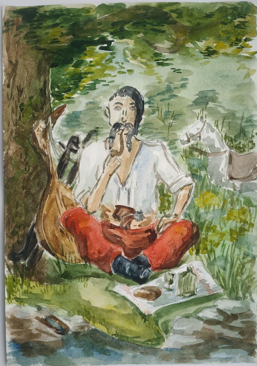
Народна картина "Козак Мамай" Чередник Анастасія (9 клас)