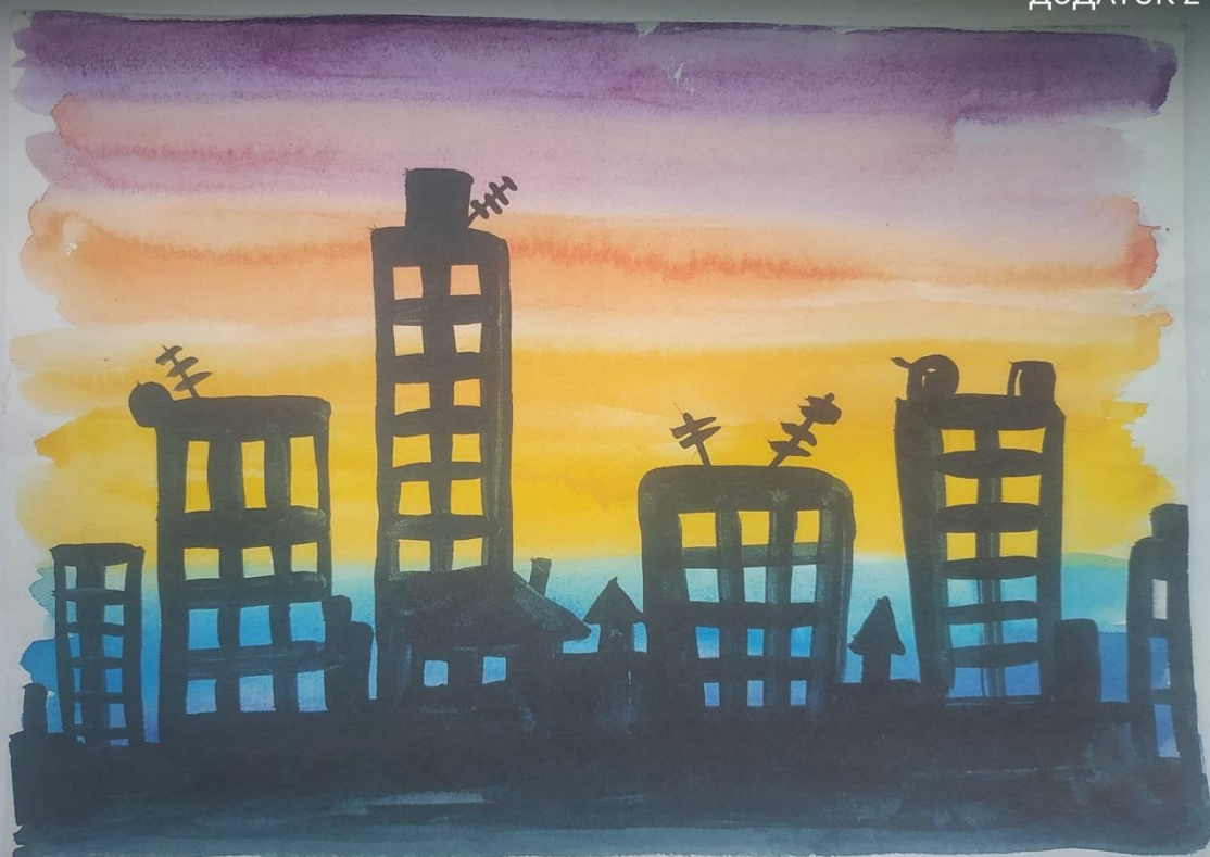
"Вечірнє місто" Базавлук Руслан (9 клас)