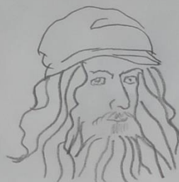
Леонардо да Вінчі