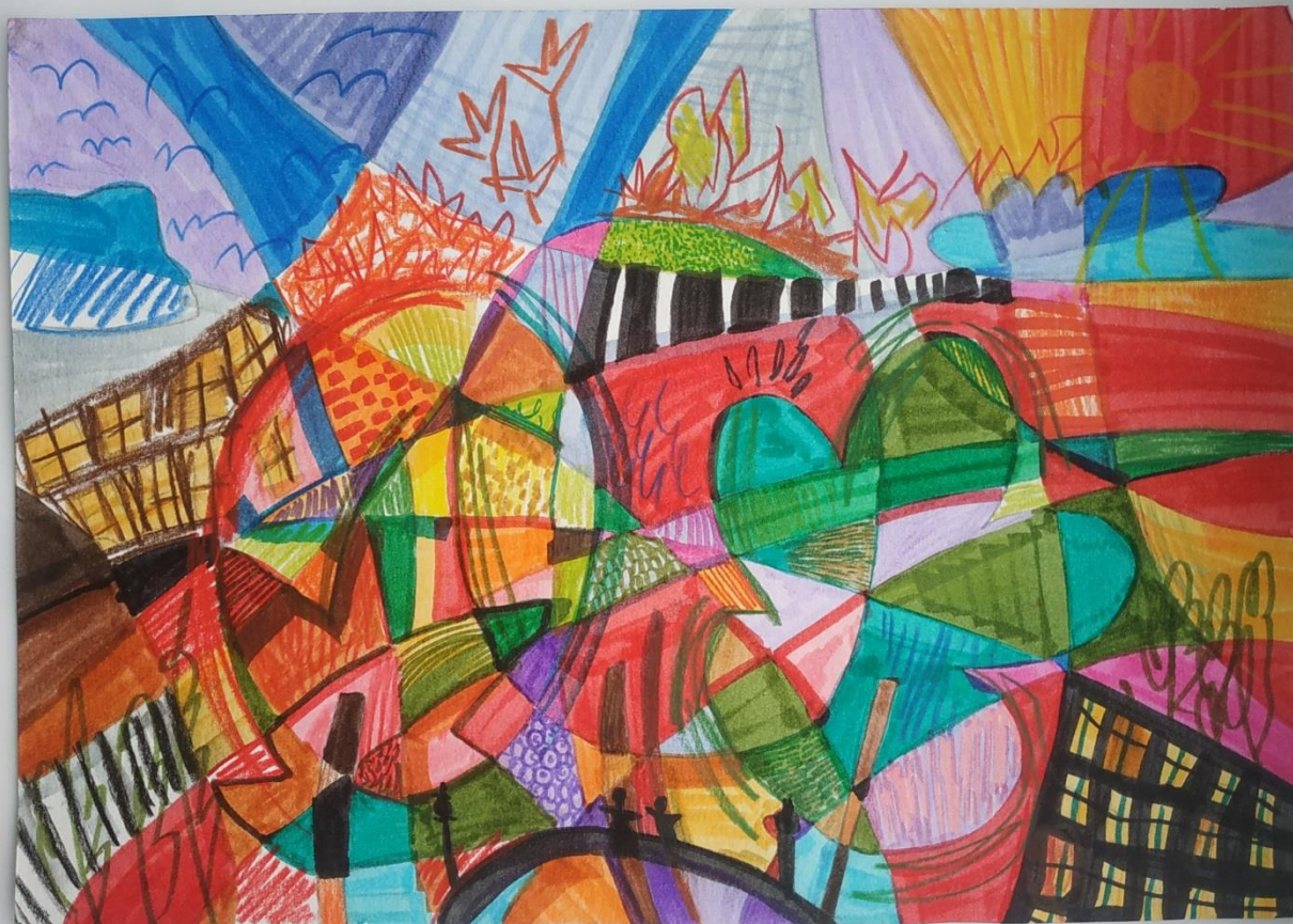
"Барви осені у стилі футуризму" Гошюдеря Марія (9 клас)