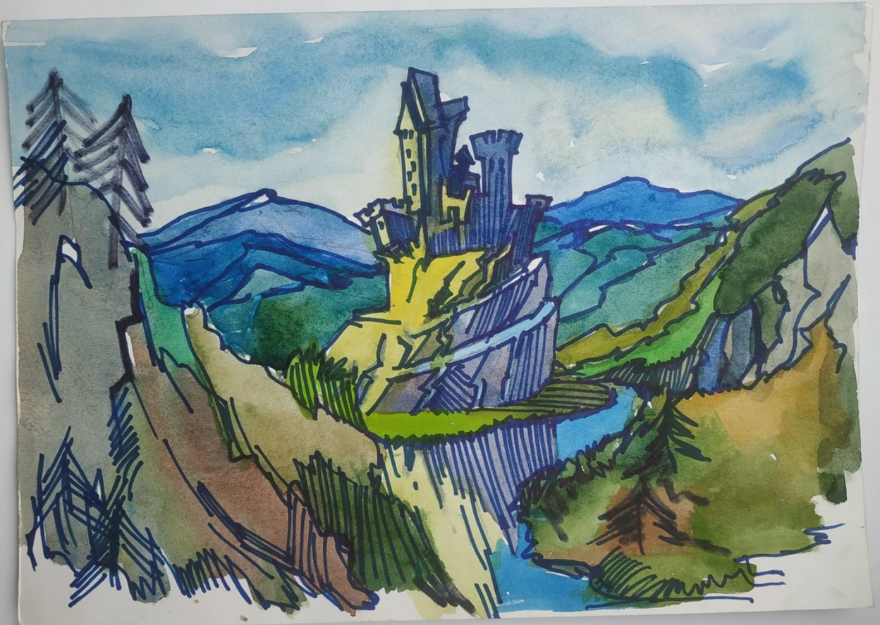
"Замок-фортеця" Петулько Ліза (8 клас)