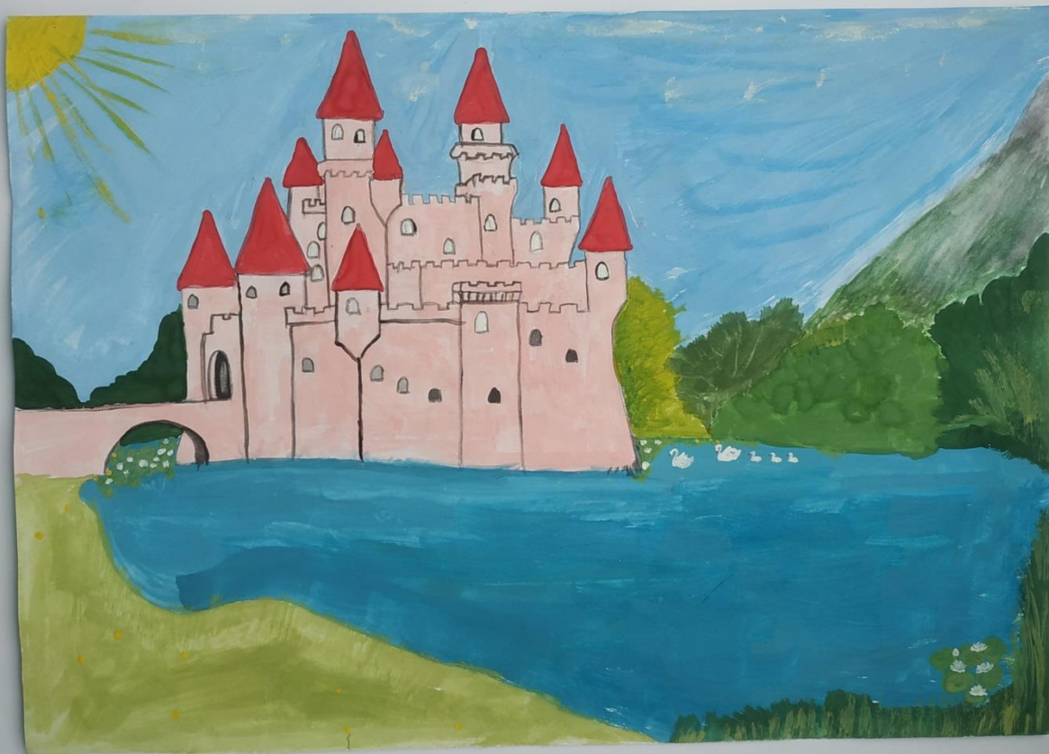
"Замок на воді" Іваненко Валерія (8 клас)