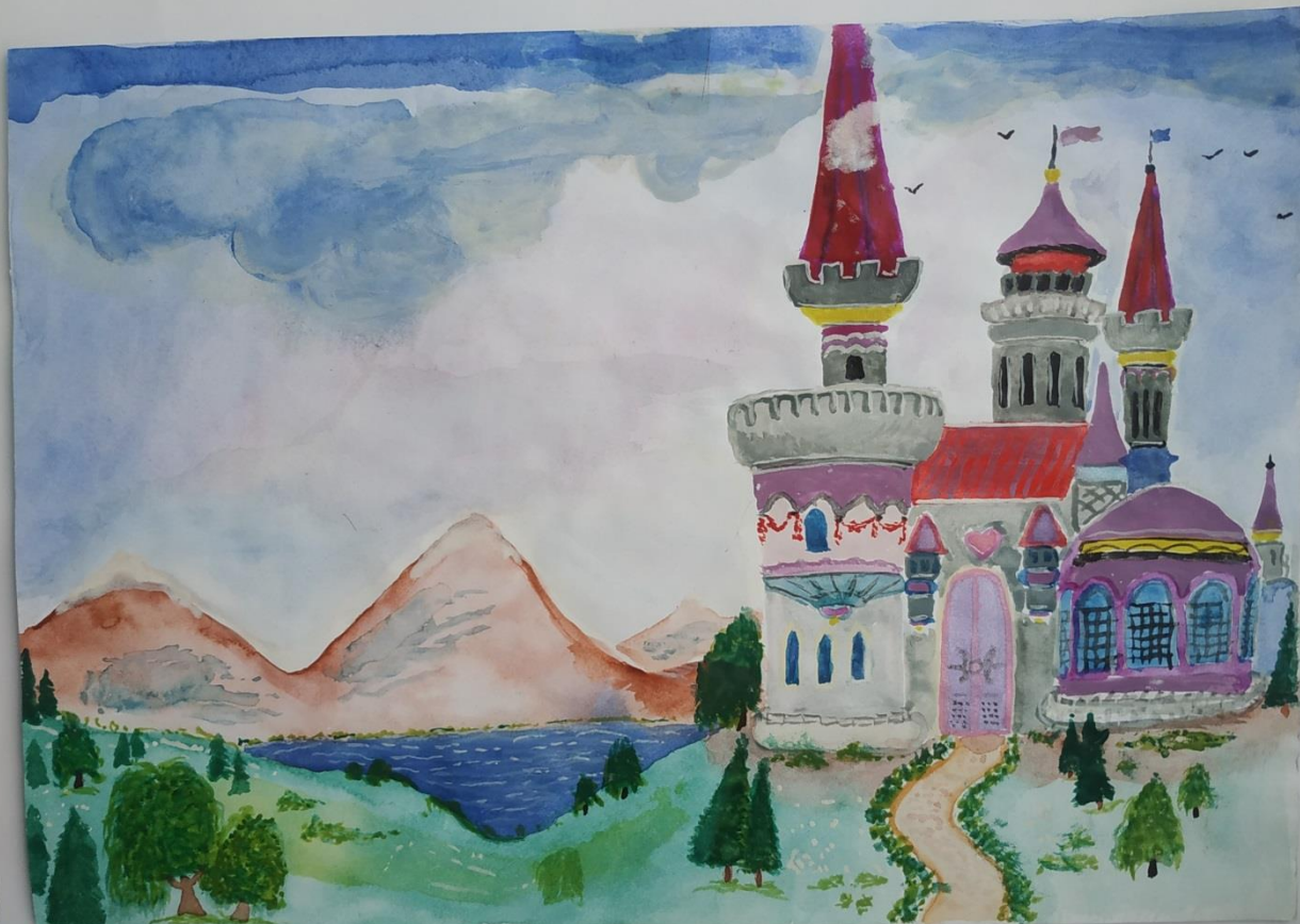
"Стамбул. Місце де захід зустрічається зі сходом" Гуржій Матвій (8 клас)