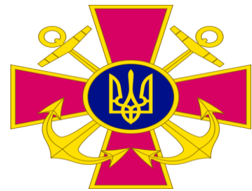
Емблема Військово- Морських Сил