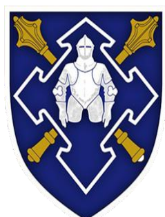
Емблема Сил логістики ЗСУ