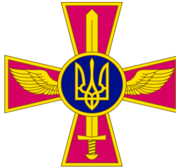
Емблема Повітряних Сил