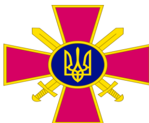
Емблема Сухопутних військ ЗСУ