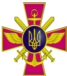
Емблема Генерального штабу ЗС України

Вчитель. В Україні існує велика кількість підрозділів Збройних Сил, і кожен із них має свою унікальну емблему. Ці емблеми створені з урахуванням традицій, історії та бойового шляху підрозділів, а також є символами честі, сили й відваги наших військових. Вони є виявом індивідуальності і значущості кожного підрозділу в системі оборони держави. ( Слайди 7-8)