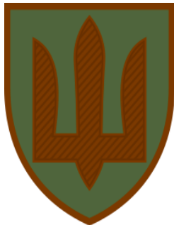
Емблема Медичних сил ЗСУ