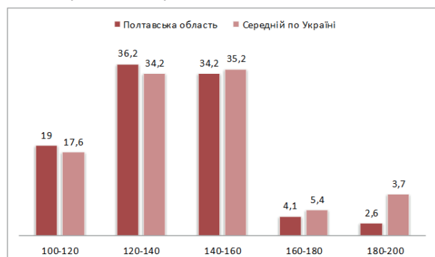
Рис. 2. Розподіл результатів учасників НМТ 2023 року – випускників поточного року – за виконання субтесту з математики

Як свідчить розподіл результатів учасників НМТ-2023, субтест із математики випускники поточного року Полтавської області склали переважно на 120–140 балів (36,2 %) та 140–160 балів (34,2 %), середній показник по Україні становить 34,2 % та 35,2 % відповідно, 4,1% випускників області отримали 160–180 балів при загальноукраїнському показнику 5,4 %.