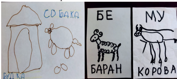
Мал. 1. Малюнки дитини з ООП у процесі вивчення букв та звуків

Знаємо, як учні не люблять, коли їм виправляють у зошиті помилки. Перед записуванням потрібного слова пропонуємо дитині протяжно вимовити і набрати його на магнітній дошці.