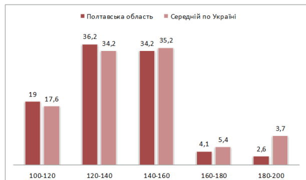
Рис. 2. Розподіл результатів учасників НМТ 2023 року – випускників поточного року – за виконання субтесту з математики

Як свідчить розподіл результатів учасників НМТ-2023, субтест із математики випускники поточного року Полтавської області склали переважно на 120–140 балів (36,2 %) та 140–160 балів (34,2 %), середній показник по Україні становить 34,2 % та 35,2 % відповідно, 4,1% випускників області отримали 160–180 балів при загальноукраїнському показнику 5,4 %.