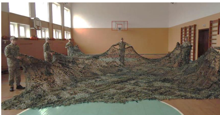
Виготовлення маскувальної сітки