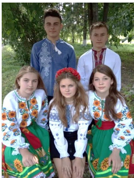
Участь у заходах до Дня Незалежності України