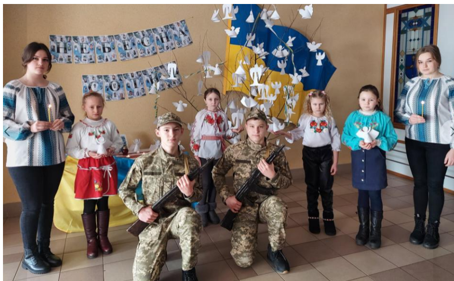
Акція «Ангели пам'яті», присвячена вшануванню Героїв Небесної Сотні