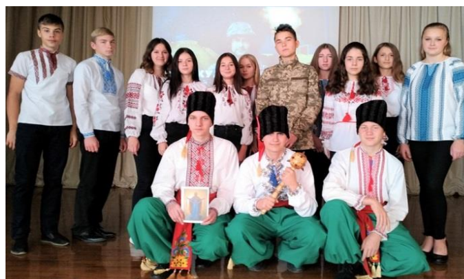
Захід «Козацькому роду -нема переводу»