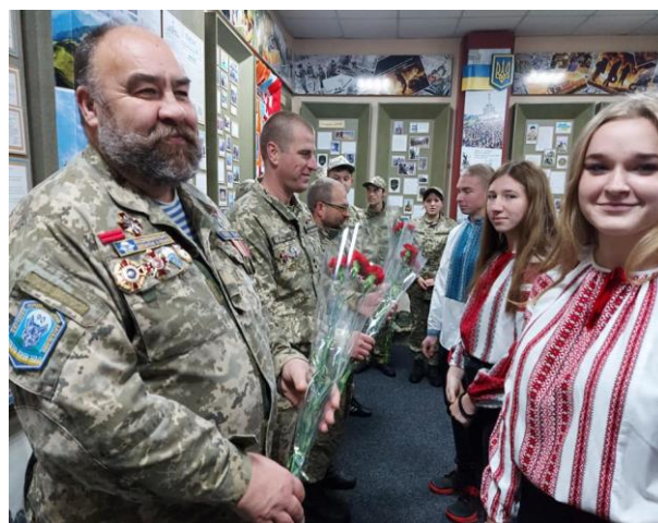
Вітання учасників бойових дій з Днем Захисників України