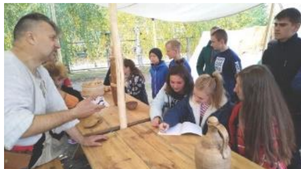
Зустріч з козаками Лубенської сотні сільської