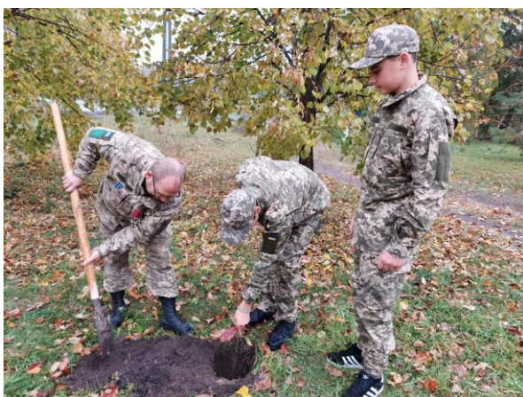
Посадка дерев Алеї Пам'яті Захисникам